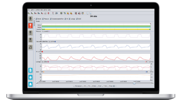
005100 Vivo 50-65 PC-Software