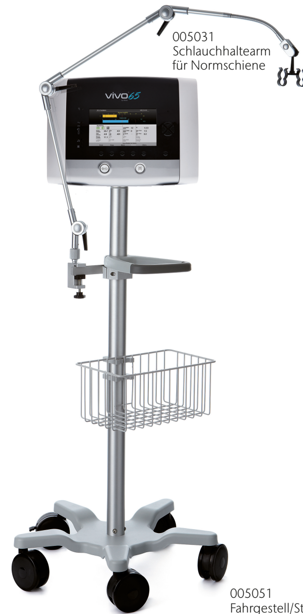
005031 Schlauchhaltearm für Normschiene