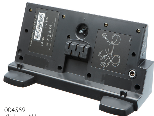
004559 Klick-on Akku