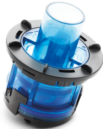
005525 Ausatemventil-Einsatz, Pädiatrische Patienten