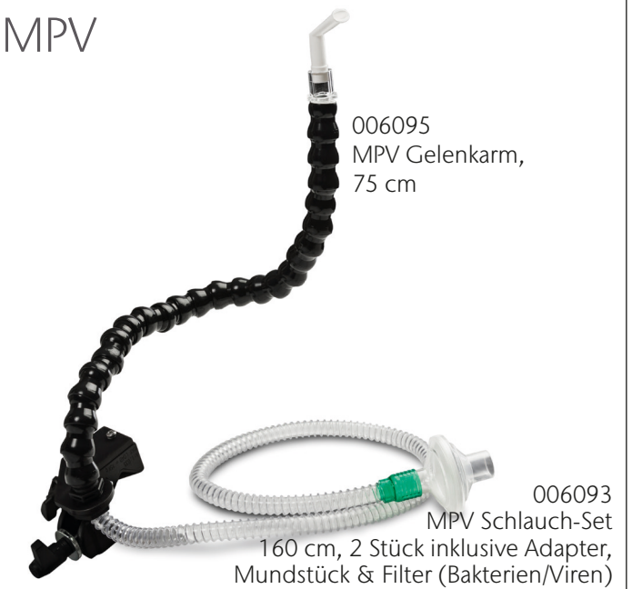
006095 MPV Gelenkarm, 75 cm