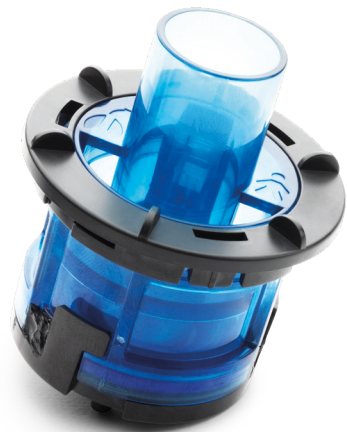
005523 Ausatemventil-Einsatz, Erwachsene Patienten