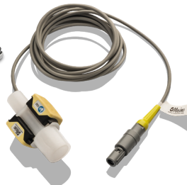
006346 IRMA CO 2 - Sensor-Kit