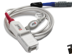
006369 SPO 2 -Modul