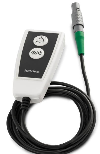
006342 Start/Stopp Fernbedienung