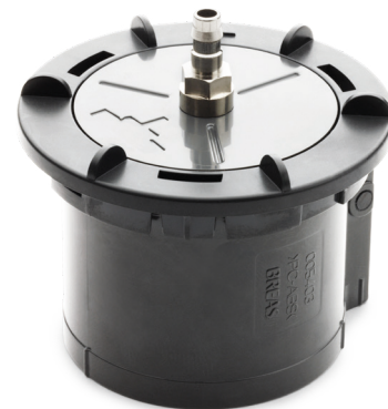
005521 Einsatz- Einschlauchsystem