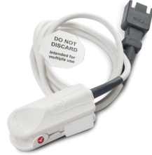
006590 SPO 2 -Finger Clip Sensor, Pädiatrische Patienten