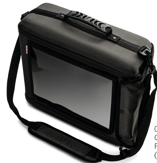
006344 Gerätehülle mit Fallschutz (Hartschale)