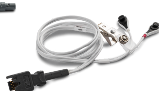
006591 Multisite Sensor