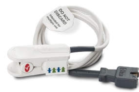
006589 SPO 2 -Finger Clip Sensor, Erwachsene Patienten