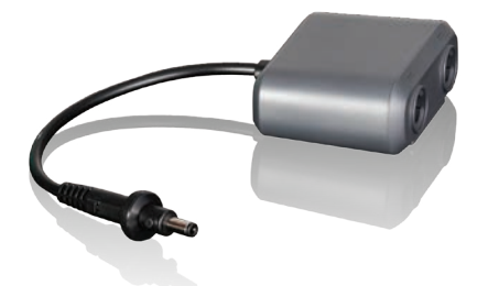
007006 Y-Kabel auf ext. DC/Netz-DC