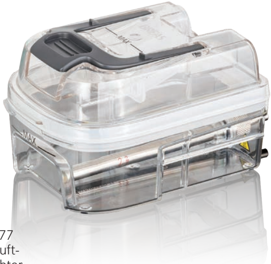
006977 Warmluft- befeuchter