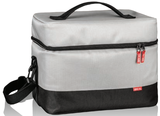
007013 Tragetasche für Gerät und Zubehör