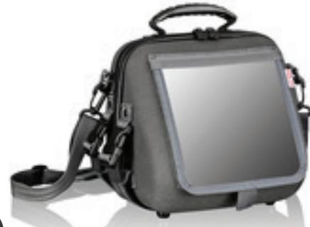
007014 Gerätehülle mit Fallschutz