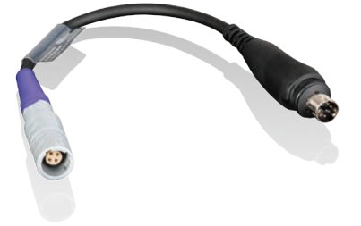
007079 SpO 2 Adapterkabel