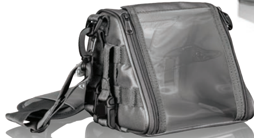
007380 Mobility Bag