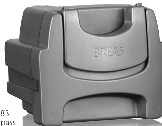
006983 Luft-Bypass Adapter