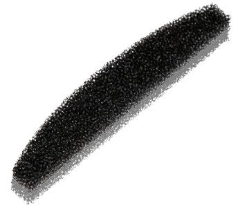
007203 Patientenluftfilter, Grob, VE/5 Stk.