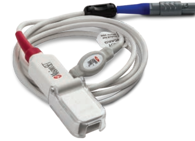
006369 SpO 2 -Modul