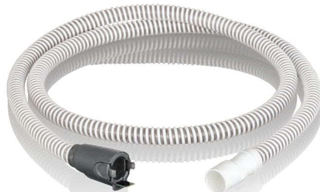
006990 Einschlauch- system, beheizbar